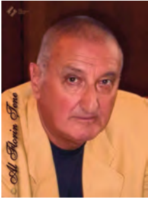
Al. Florin ȚENE

Cazul lui Ioan Slavici reprezintă una dintre cele mai tulburătoare pagini ale istoriei culturale românești din preajma Marii Uniri. Scriitor canonic, autor al unor opere fundamentale pentru proza românească modernă, Slavici a fost, în același timp, una dintre cele mai contestate figuri publice ale epocii sale. Acuzat de trădare și spionaj, umilit public, închis și lipsit de manuscrise, el a trăit drama intelectualului care, fidel propriilor convingeri, a ajuns „de partea cealaltă a istoriei”.