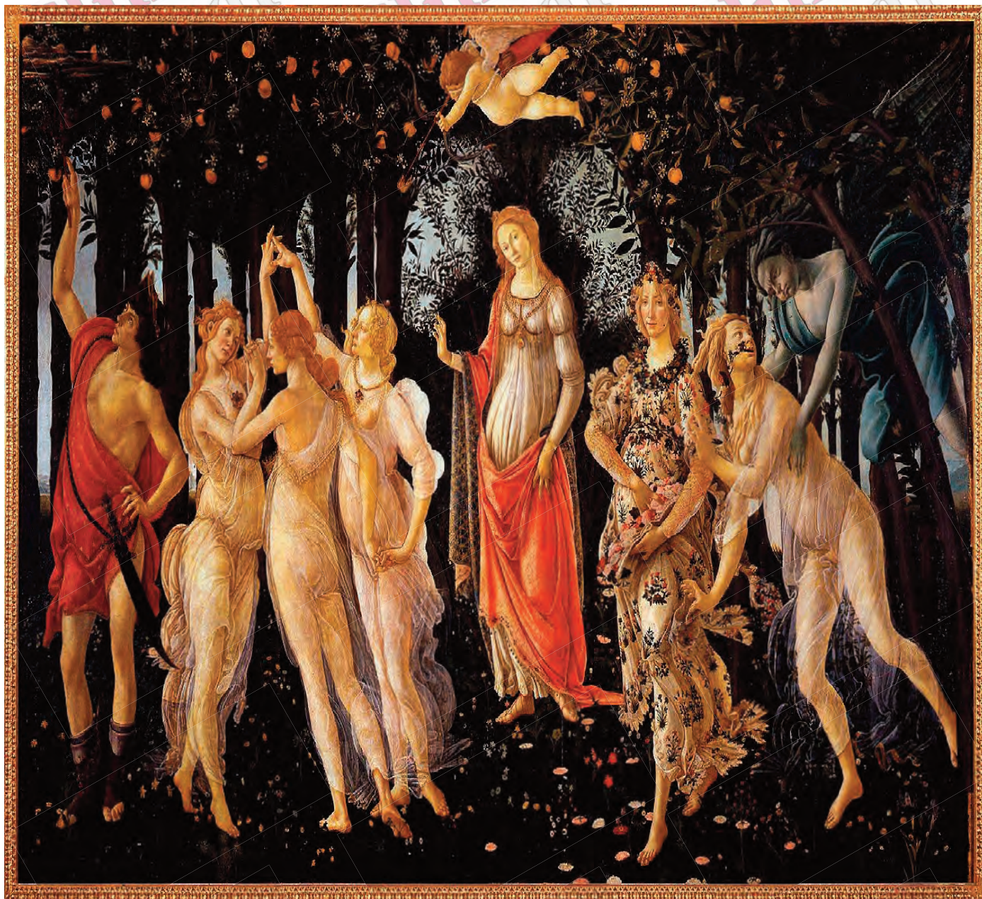
„Primăvara” de Boticelli